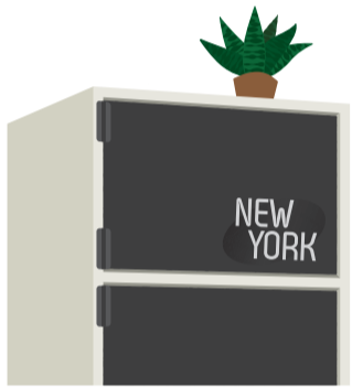
100円ショップのプラスチックドアに英字のステッカーを貼るなどさらにアレンジすればもっと素敵になりますよ。

カラーボックスに扉をつければ、よりおしゃれな家具にグレードアップ！100円ショップのカラーボックス用のプラスチックドアなら、付属のパーツに両面テープでカラーボックスに取り付けるだけでOKです。サイズが合えばコルクボードもグッド！このことをカラーボックス全体の扉に使えば、カントリーテイストに仕上がります。