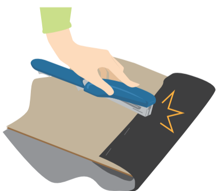
マットづくりは、タッカーがなかったら、ホチキスを開いた状態で芯が出るところを強く押せば留められます。

2 カバー用の布を裏側に広げ、その上にウレタンフォーム、さらにその上に天板用の板を置く 3 布を引っ張りながら板ごと布をくるみ、周りをタッカーで留める。 天板用の板はホームセンターでサイズに合わせてカットしてもらえますので、事前にサイズを測りましょう。インテリアの幅が広がるカラーボックス。どんなアレンジして楽しく使ってくださいね！